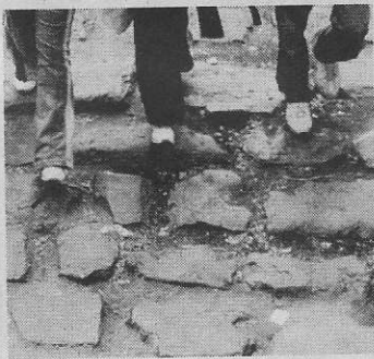
Mit Kölner Stadtführern unterwegs

riesigen, silbrig schimmernden Industrieanlagen dort hinten in dunstiger Ferne zum Beispiel – was mag das sein? Oder der rätselhafte, bläuliche Quader rechts? Der türmchenbewehrte Bau im Grünen – bloß wenige Hundert Meter entfernt?