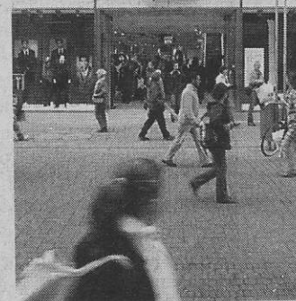
H&M im neuen Geschäft in der Schildergasse